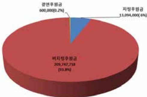
2017년 후원금 수입