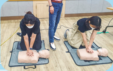
7/11 종사자 심폐소생술 교육