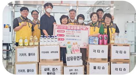
9/26 대연3동 행정복지센터 물품 후원