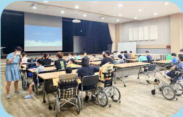
8/23~8/24 이용인 인권교육