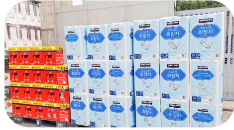
9/12 (주)코스트코코리아 물품후원