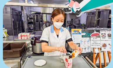
8/25 이용인 영양교육