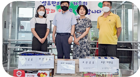
8/4 남수영구 약사회 의약품 후원