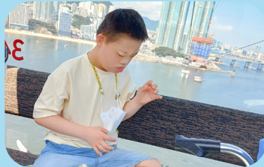
8/14 송도 해수욕장 물놀이&케이볼카