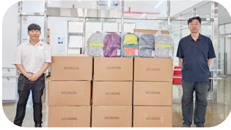
8/11 (주)코스트코코리아 가방 후원