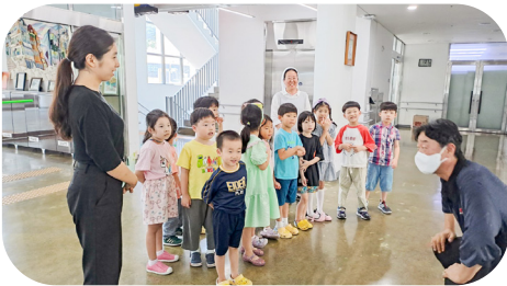
7/21 은하유치원 바자회 성금 전달

추석을 맞아 따뜻한 손길이 이어졌습니다. 덕분에 풍성하고 행복한 명절 보냈습니다.