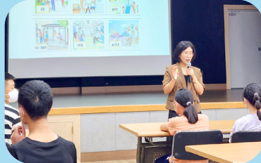
8/17 이용인 성교육