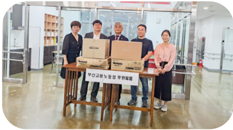
9/25 고용노동청 물품 후원