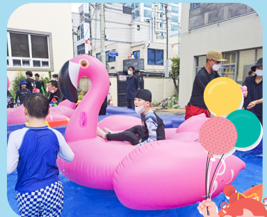
8/8 초록우산어린이재단 현재자동차그룹 지정기탁 사업 에어바운스 물놀이