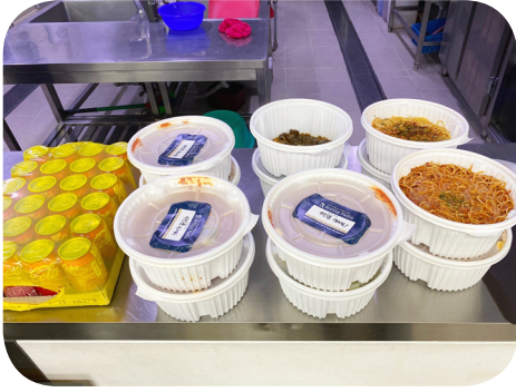
5/5 김0수♥김0지 후원자 파스타 후원

어린이 날을 맞아 따뜻한 손길이 이어졌습니다. 덕분에 풍성하고 행복한 어린이날 보낼 수 있었습니다.