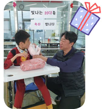
5/15 성년의 날