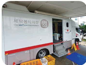
3/18, 6/18 대한적십자사 이동세탁차량 세탁봉사