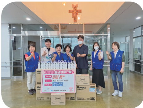
6/21 바르게살기운동 대연3동 위원회 물품후원