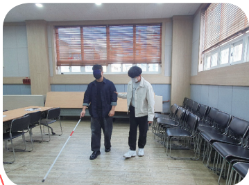
3/18, 6/6 흰지팡이(장애)체험