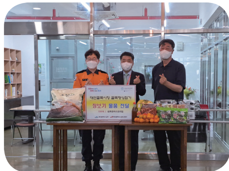
6/21 부산광역시 남구청, 남부소방서 장보기 물품 전달

♥ 어린이날을 축하해 주신 윤0렬, 공0민, 장0선, 솔잎, 후원협의회 후원자님 감사합니다. ♥