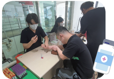
6/5 이용자 건강검진