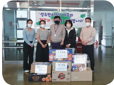
5/4 남수영구 약사회 의약품 후원