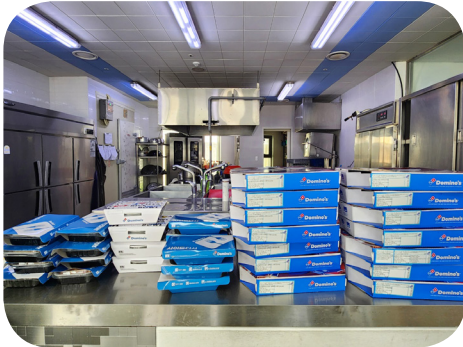
6/25 김0주 후원자 피자 후원