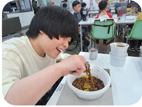
5/31 박0 후원자 짜장면 후원