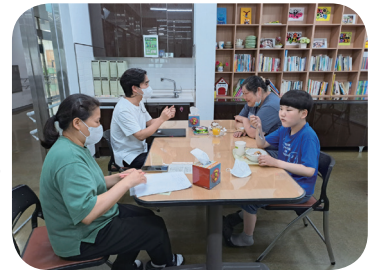
6/28 보호자 간담회