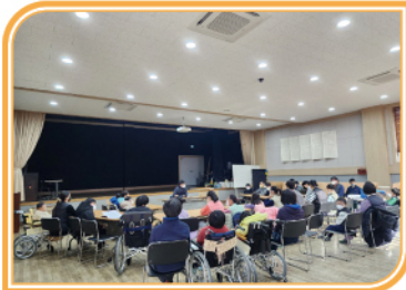
햇님방 장관 교체