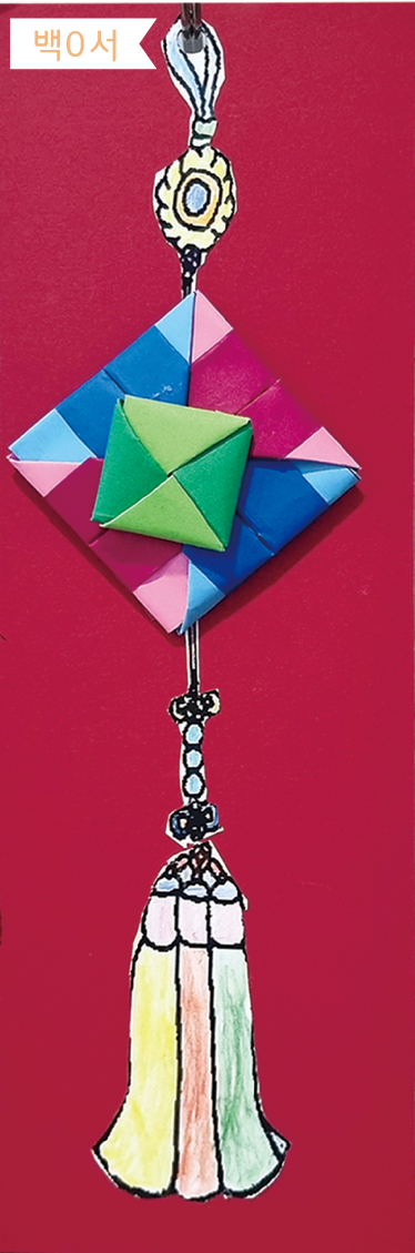
한국의 전통 노리개