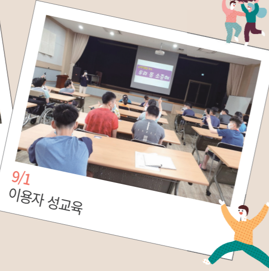
9/1 이용자 성교육