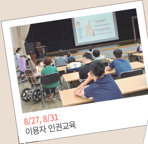
8/27, 8/31 이용자 인권교육