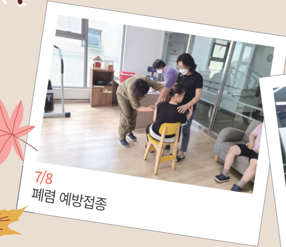
7/8 폐렴 예방접종