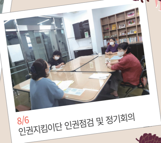
8/6 인권지킴이단 인권점검 및 정기회의